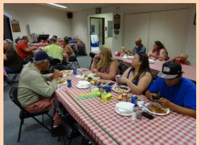
La imagen de arriba son los residentes de Hinkley disfrutando de la barbacoa anual del Gerente de IRP / CAC, que se celebró en mayo en el Hinkley Senior y Centro Comunitario.