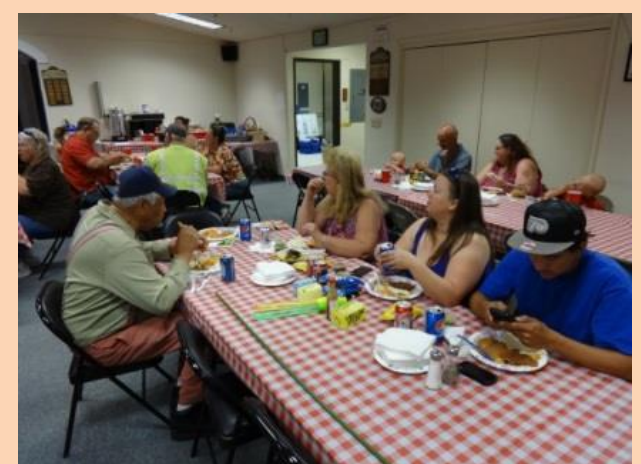
Pictured above are Hinkley residents enjoying the annual IRP/CAC BBQ that was held in May at the Hinkley Senior and Community Center.